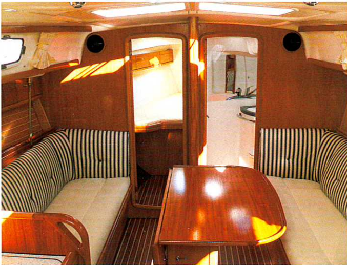
Der Salon mit seinen beiden großen Panoramasscheiben. In die Eigner­kammer im Vorschiff ist der große Was­chraum integriert