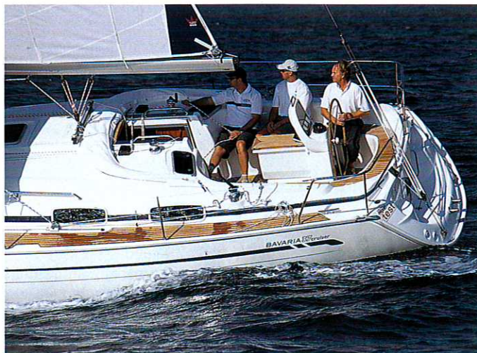
Perfekt: der glatte Ablauf am Heck bei sechs Knoten Fahrt

leren Vorschiff, bietet der Wasorraum mit Dusche reichlich Bewegungsfreiheit. Da