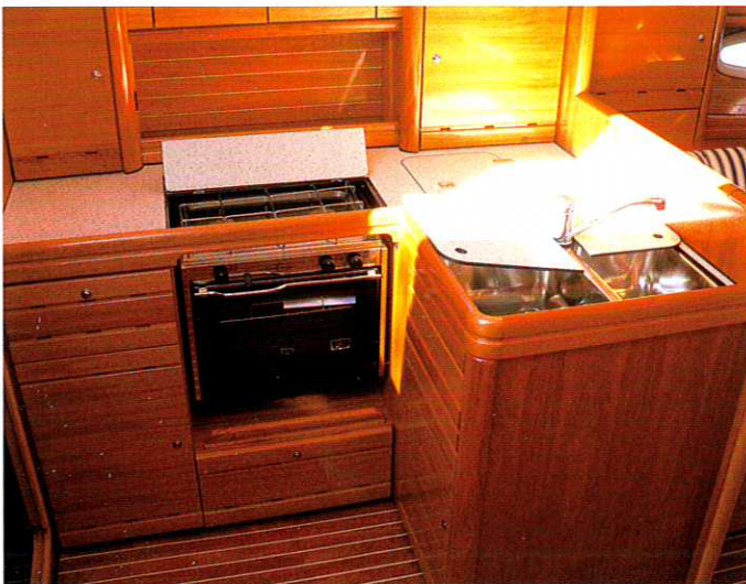
Die Pantry erhält zusätzlich Licht und Luft durch eine Deck­sluke. Alle Türen der Schapps sind mit Lüftungsschlitzen versehen