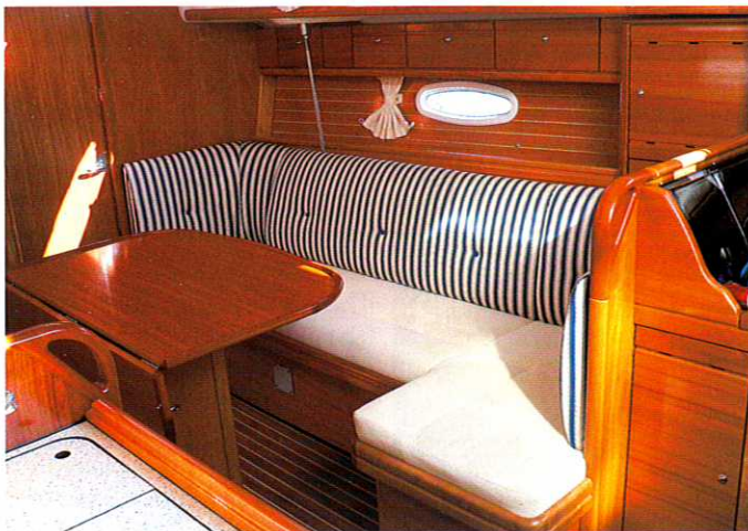
Das 2,20 Meter lange Sofa läßt sich zur bequemen Seekoje umbauen, dahinter die Ablage mit hübscher Wegerung und Rumpffenster

aus insgesamt fünf Lagen besteht: Die tragenden Fäden sind beidseitig durch Folien eingeschlossen, die von außen durch sehr feines Polyester­gewebe (Tafetta) vor rauer Behandlung geschützt werden. Weiterhin trägt die hohe Stabilität des niedrigen Gewichts­schwerpunktes, der große Tiefgang (1,95 Meter) und die relativ große Breite zu diesen Leistungen bei. Sie erlauben hohes Segel­tragevermögen mit den rund 68 Quadratmetern am Wind. Schließlich sorgen die kurze Wasserlinie und der in ihrem Bereich sehr scharf geschnittene Vorsteven für weiches Einsetzen im Seegang und damit geringen Fahrtverlust auf Kursen am Wind.