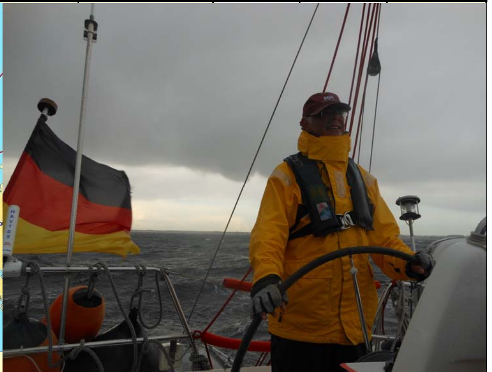
Sturmfahrt! 8 Windstärken gegenan!