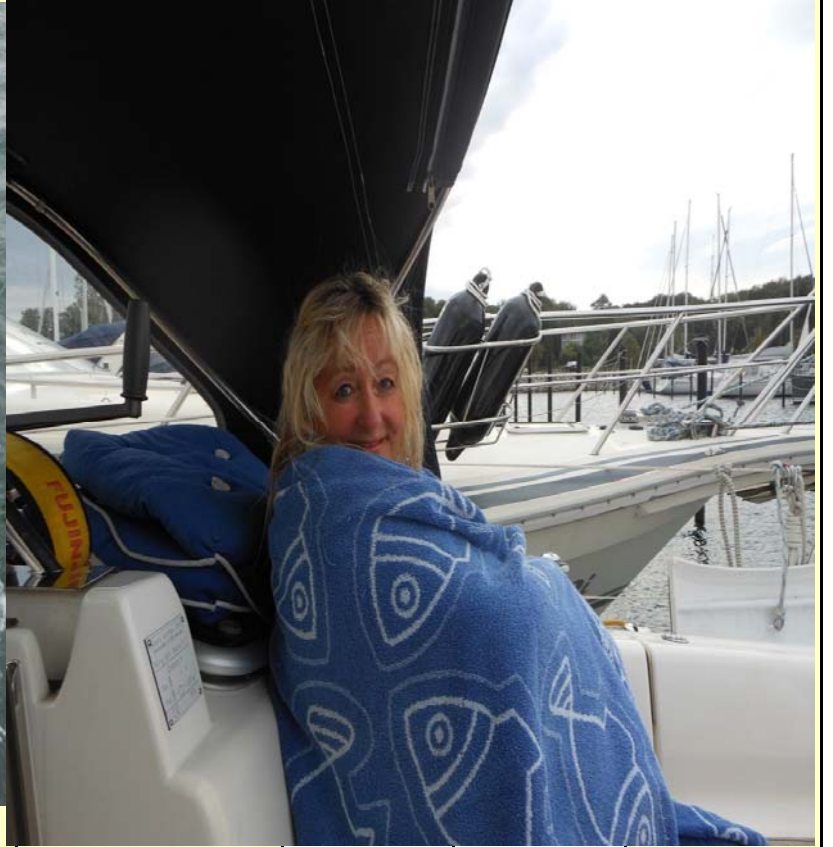
Hafentag, Sonne, Sturm und Regen